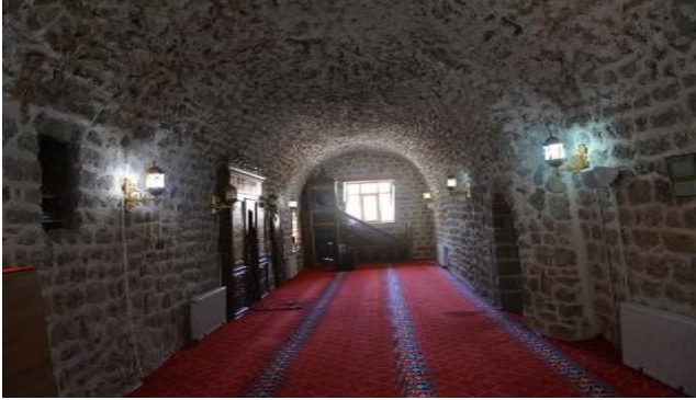
Resim 3: Emir Şaban Cami-i

Çukurca'da medrese eğitiminin eski zamanlardan beri bulunduğu dair çeşitli veriler bulunmaktadır. Bunlardan ilki uzun bir süre ilmi çalışmalarda bulunan Molla Ömer el-Çellî ailesinin Çukurca'daki varlığıdır. Bu çok yönlü âlimin tam ismi Ömer b. Ahmed b. Molla Muhammed b. Molla Ömer b. Molla İbrahim el-Çellî, el- Maî'dir. "Çelî" künyesi memleketi Çukurca'nın Kürtçe ismi olan Çelê'den, "Maî" nisbesi ise Çukurca'nın güneyinde 6 kilometre Irak sınırı içerisinde bulunan ve Berwarî Bala denilen bölgede bulunan Maî Köyü ve buradaki medresede ders vermesine dayanmaktadır. İlim ile meşgul olan köklü bir aileye mensup olan Molla Ömer b. Ahmed'in 1655'te hayatta olduğu bilinmekle beraber doğum ve ölüm tarihleri tam olarak bilinmemektedir. Birçok eser kaleme alan Molla Ömer'in babası ve dedesi de önemli âlimler olup eserler yazmışlardır. 2 Bu ailenin uzun yıllar Çukurca'da ilim tedarisiyle meşgul