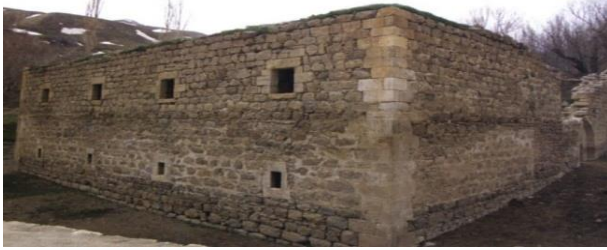
Resim 5: Pizan Medresesi

Pizan Medresesi'nde istinsah edilen çeşitli yazma nüshalardan medresedeki tedrisat faaliyetlerinden haberdar olmaktadır. Hüsrev