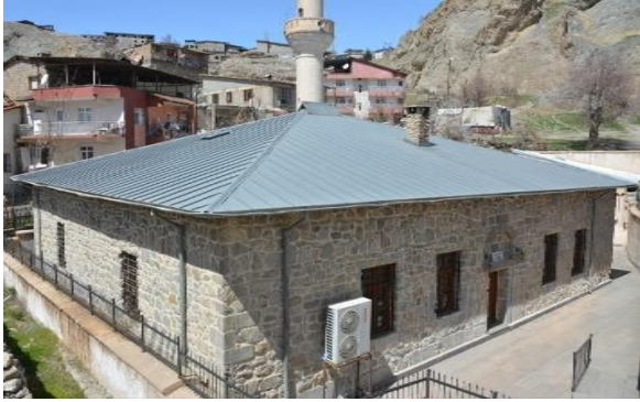
Resim 1: Melik Esed Cami-i ve Medresesi

Hakkâri bölgesindeki çeşitli medreselerin 19. yüzyılın sonuna kadar faaliyetlerini sürdürdükleri vakıf muhasebe kayıtlarından anlaşılmaktadır. Özellikle II. Mahmud'un (ö. 1939) merkezileşme politikaları neticesinde Kürt emirliklerinin ortadan kaldırılmasıyla Hakkâri bölgesindeki vakıflar da idari ve mali açıdan merkeze bağlandı ve resmi kayıtlara girmeye başladı. Bu meyanda Melik Esed Cami-i ve Medresesi vakfı kayıt altına alındı. İlk olarak 1849/50 tarihlerinde Hakkâri Sancağı dâhilinde bulunan medrese ve camilere ait vakıflar tanzim edilmeye başlandı. Bu ilk kayıtlarda vakıfların gelirini oluşturan köyler ve gelir miktarları kaydedilmiştir. Kayıtlarda Elbak (Başkale), Culemêg (Hakkâri) ve Gever (Yüksekova)