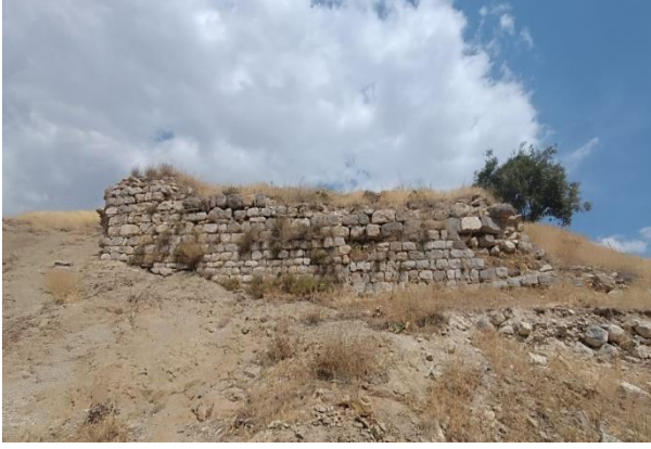
Resim 6: İzzeddin Şir Bey Cami-i ve Medresesi