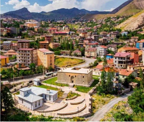
Resim 8: Meydan Medresesi

almaktadır. Düzgün kesme taş ile inşa edilen medresede bağlayıcı malzeme olarak kireç hare kullanılmıştır. 1