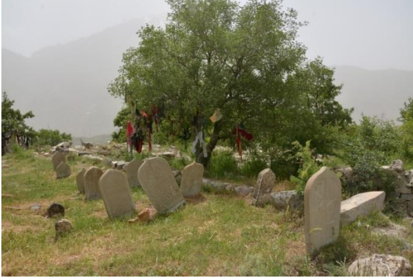
Resim 7: Kızıl Kümbet/Gumbeta Sor Medresesi 10. Hakkâri Meydan Medresesi

bilinmemekle beraber, bu medresede 1097/1686 tarihinde Abdullah b. Mustafa el- Pınyanışi tarafından istinsah edilen “Külliyatı Sadı” isimli yazma nüshadan, söz konusu dönemde faal olduğu anlaşılmaktadır. Bu yazma nüsha Dar’ül-Mahtutat Irakıyye’de 16142 numarada korunmaktadır. Bu nüshada bahsedilen dönemde