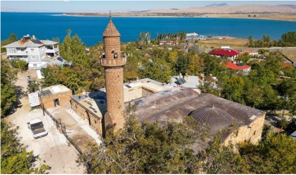
Resim 2: Gevaş İzzeddin Şir Bey Cami-i ve Medresesi