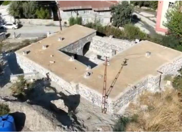
Resim 4: Zeynel Bey Medresesi

dışında da bu medresede istinsah edilen çeşitli yazma eserlerden medresede tedrisatın uzun bir süre devam ettiği anlaşılmaktadır. Mahmud b. Faki Ali b. Cemaleddin b. Bahaeddin b. Şeyh Mahmud, 987 /1579 yılında istinsah ettiği bir yazma nüshada, bunu “Culemêrg Köyü” Zeyneliyye Medresesi’nde yazdığını belirtmiştir. Yazma nüsha 17516 numarasıyla Daru’s-Saddam li’l-Mahtutat yazma eserler kütüphanesinde kayıt altına alınmıştır. 1 Bir başka yazma eser ise 1149/1736 tarihinde Culemêrg beldesinde Zeyneliyye Medresesi’nde İbrahim Han Bey’in yönetimi esnasında istinsah edilmiştir. Bu nüsha da 2/20302 numarasıyla