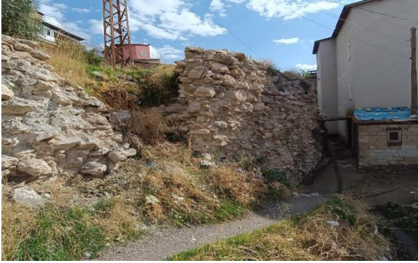
Resim 9: Kale Kapısı/Kırnıkan Cami-i ve Medresesi